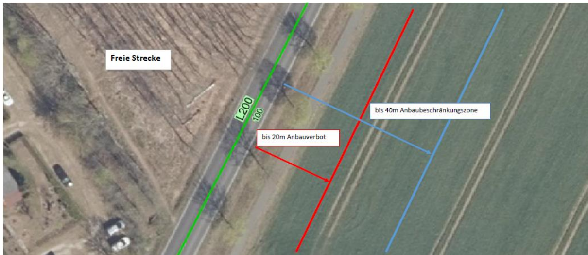
Freie Strecke – Visualisierung der Anbauverbots- und Anbaubeschränkungszone